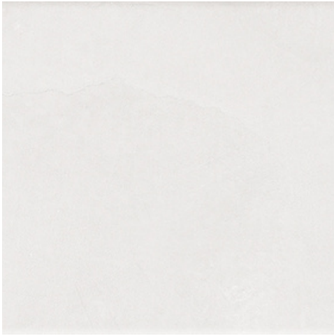
ALURE SCALE WHITE