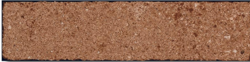
BLOCK COTTO MAT