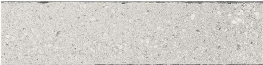
BLOCK PEARL MAT