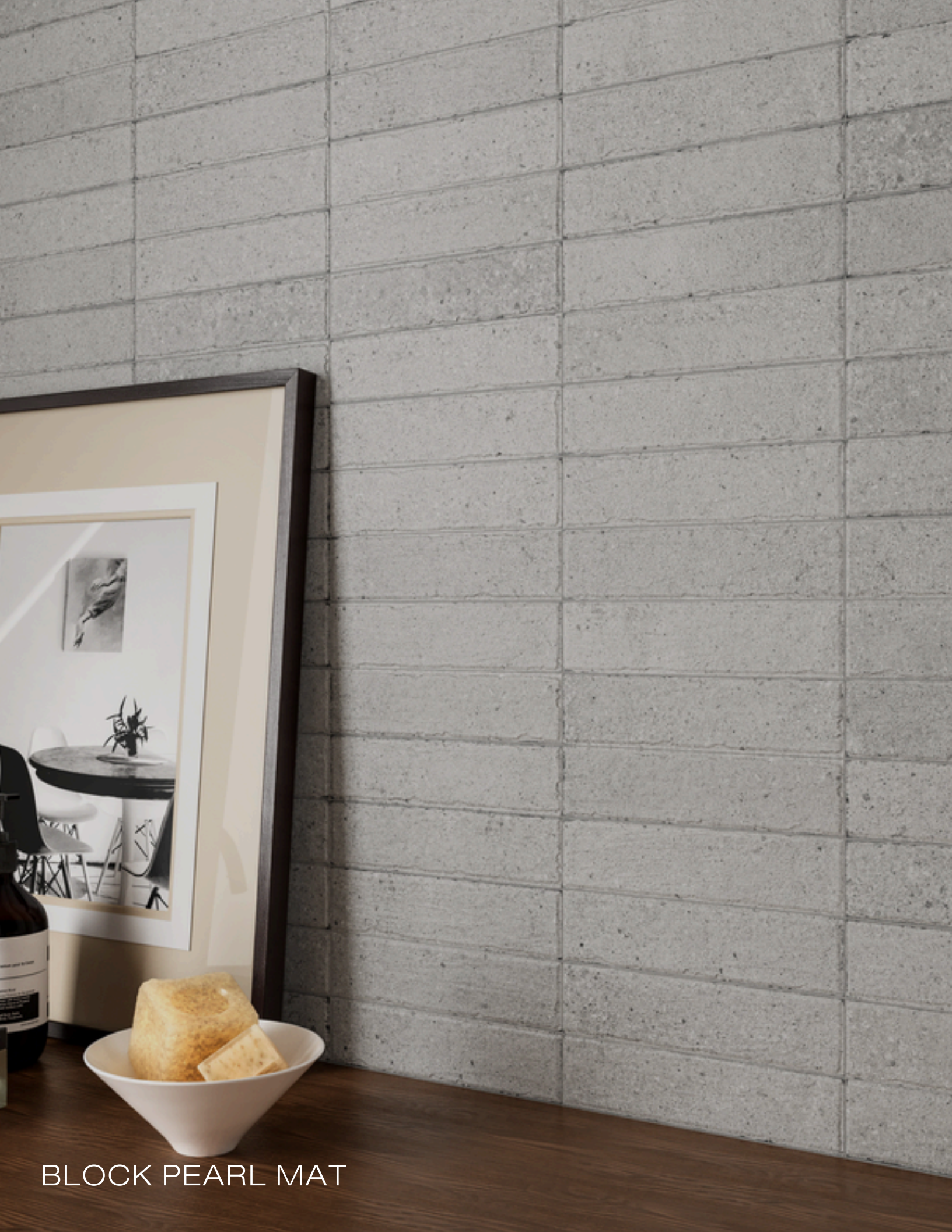
BLOCK PEARL MAT