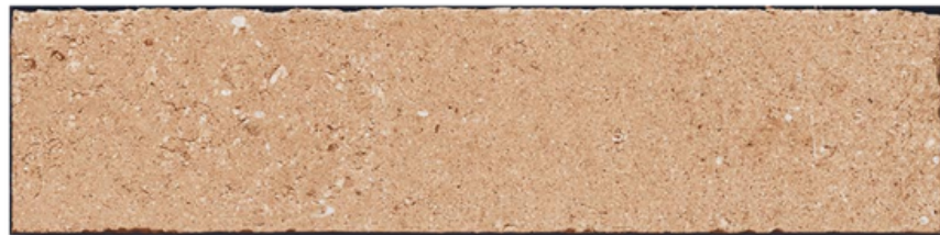
BLOCK SAND MAT