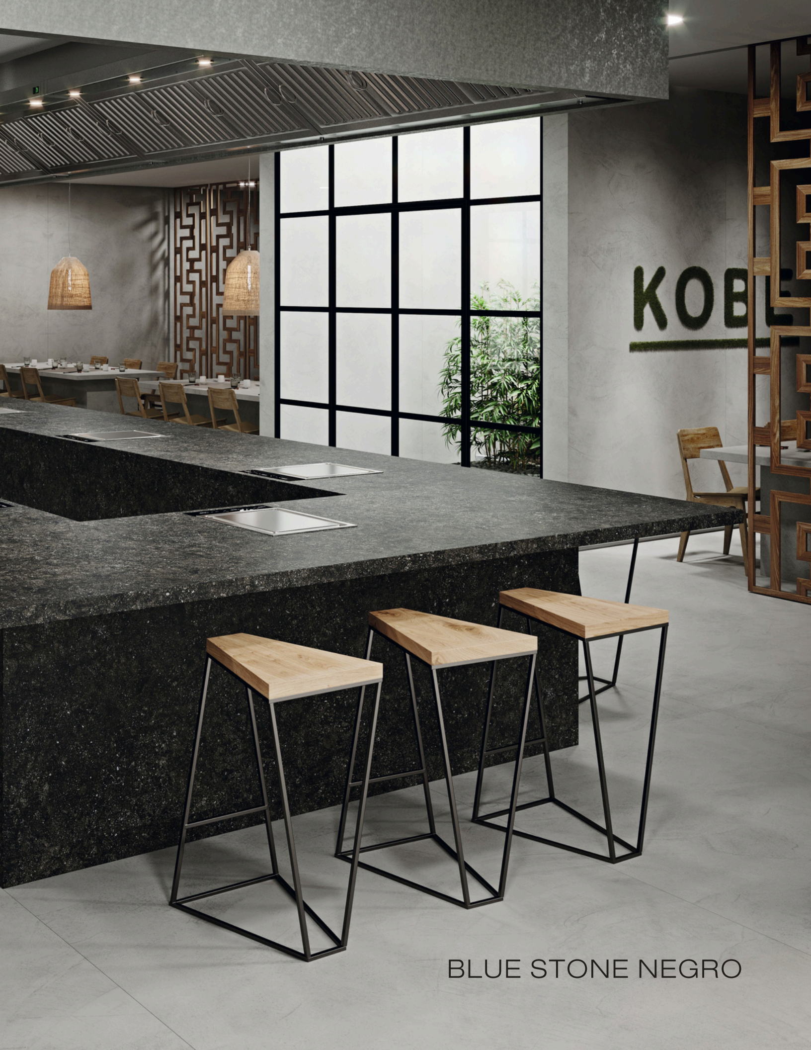
BLUE STONE NEGRO