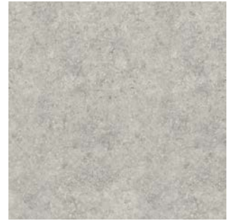
BLUE STONE GRIS