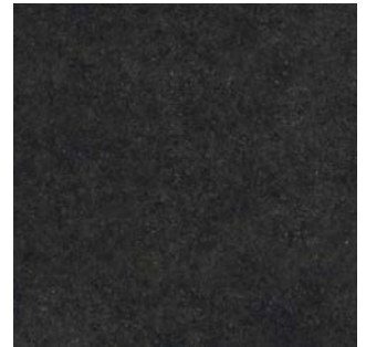
BLUE STONE NEGRO