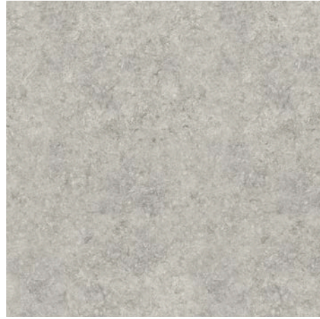
BLUE STONE GRIS