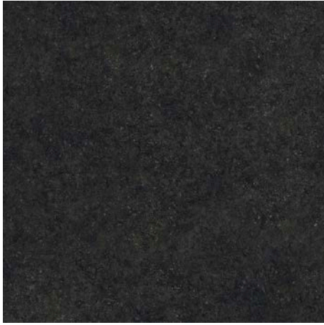
BLUE STONE NEGRO