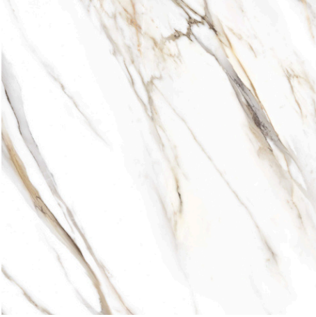
CALACATA GOLD PUL