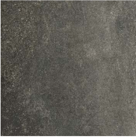
LAVA STONE BLACK