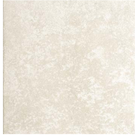
LAVA STONE IVORY