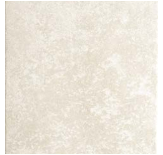
LAVA STONE IVORY