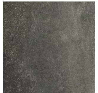
LAVA STONE BLACK